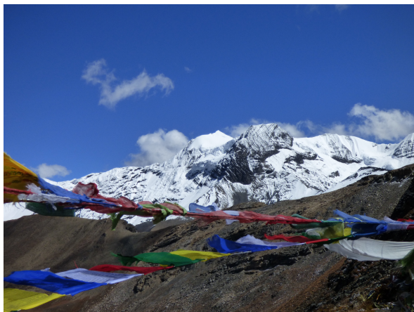
Trek v bhútánském Himálaji