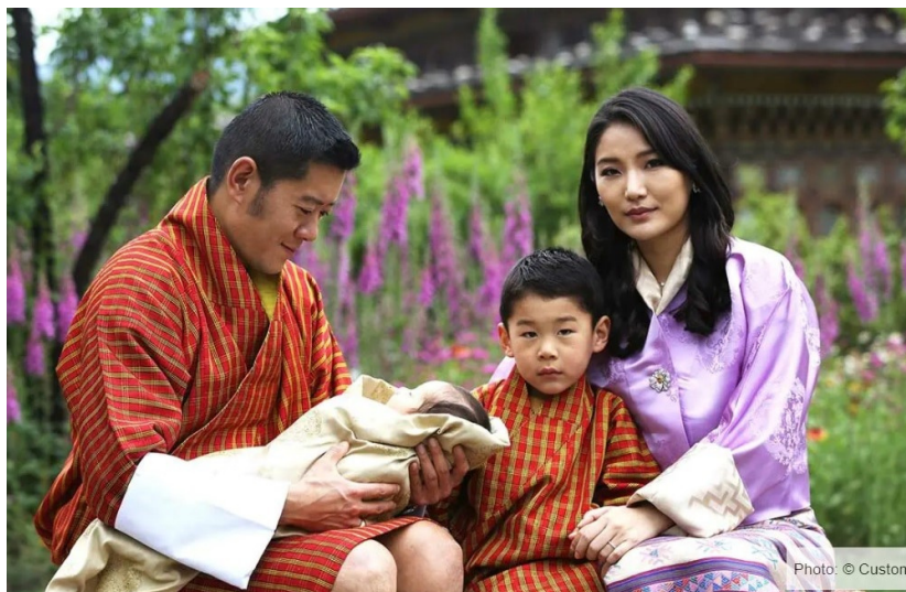
Současný pátý král Bhútánu, královna a jejich dva synové.

Celá královská rodina je velmi vážená a milovaná. Může se vám poměrně lehce stát, že některého z její členů uvidíte na slavnosti tšechu nebo při humanitární činnosti. Členy královské rodiny je ale zakázáno fotit.