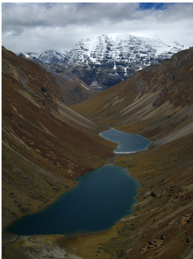
Jezero Tso phu - z treku kolem hory Džomolhari

Pokud si na takovýto trek netroufáte, ale přesto byste se chtěli podívat někam výš a kochat se panoramaty, Země draka nabízí množství variant od nenáročného dvoudenního Bumdrak treku nad Tygří hnízdo až po šestidenní trek pod posvátnou horou Džomolhari .