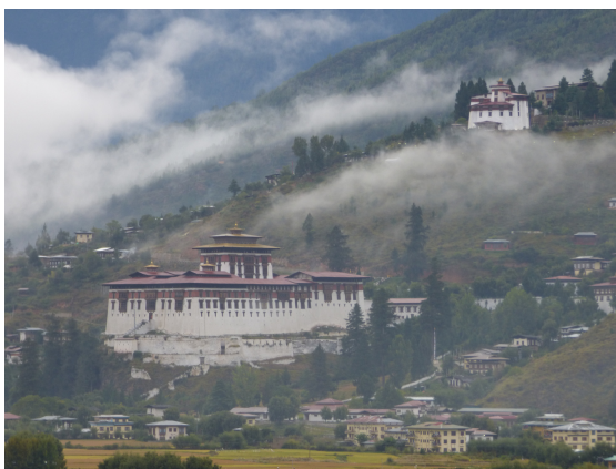
Výhled z hotelového pokoje na Paro dzong

Sumu za celý pobyt zaplatíte na účet Výboru pro turistiku ještě před příjezdem na území Bhútánu. 65 USD z této částky pak míří přímo do královské pokladnice . Z ní se hradí výstavba cest, nemocnic, škol a tak dále. Zdravotnictví a školství je v Bhútánu pro všechny obyvatele zdarma. Tento tzv. „královský“ poplatek už neplatíte po čtrnáctém dni pobytu.