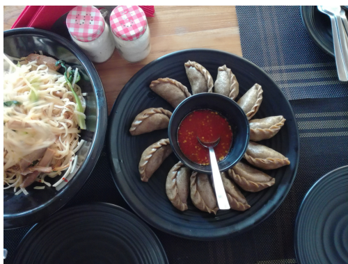
Pohankové taštičky hoentey plněné zeleninou s chilli omáčkou ezay

Starbucks a McDonald's sem našťestí ještě nedorazil (CocaCola už ano).