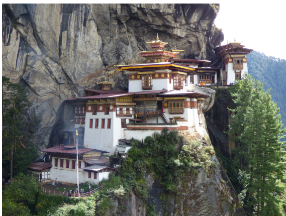
Klášteř Taktsang - Tygří hnízdo - ikona Bhúťánu

Nejznámějším, nejnavštěvovanějším, nejfotogeničtějším a nejposvátnějším z klášterů je Tygří hnízdo – Taktsang . Sem prý kdysi přiletěl velectěný buddhistický učitel Guru Rimpoče (Padmasambava) na tygřici a meditoval v jeskyni, aby pokořil démony, kteří sužovali místní kraj a bránili šíření buddhismu.