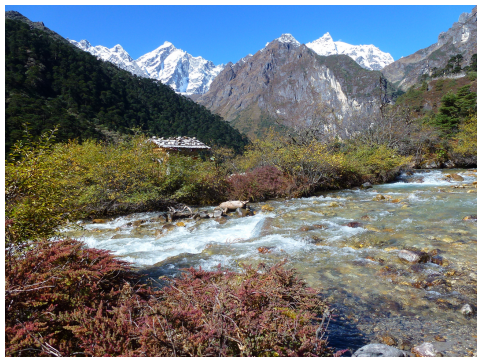
Počasí v říjnu je ideální na vysokohorské trekky

Pokud cestujete sami (jedna osoba), je tento poplatek vyšší. A pokud jedete sami na trek , může se cena vyšplhat i na 350 USD za den .