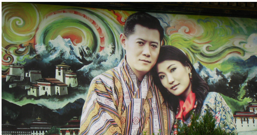
Současný pátý král a královna na "billboardu"

Billboardy nejsou v zemi povolené , aby ji nehydily. A když už nějakou plochu připomínající billboard uvidíte, budou na ní nejspíš zobrazeni členové místní vážené královské rodiny.