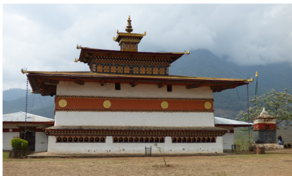
Obyčejně vypadající ale velmi mocný - Chrám plodnosti

Tibetský láma Drukpa Kunley, známý také jako Božský blázen nebo Bláznivý světec, šířil buddhismus velmi netradičním způsobem, tedy pomocí tance, zpěvu, alkoholu a posvátného sexu, kterým je možné dojít k osvícení. Díky tomu mohl toto učení chápat i prostý lid.