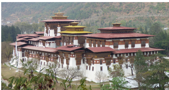
Klášteř Punakha - místo korunovace kráľů

Punakha , bývalé hlavní město, leží na soutoku mužské (Po Ču) a ženské (Mo Ču) řeky. Název dzongu (klášterní pevnosti) v překladu znamená Chrám velikého štěstí a konají se zde korunovace a královské svatby. Nástěnné malby v jeho chrámové části vás provedou celým životem Buddhy.