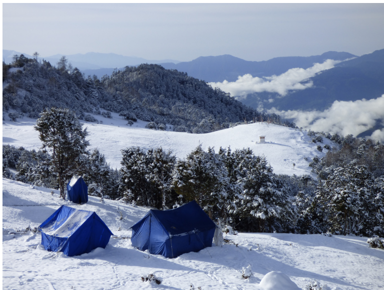
Každé roční období má své kouzlo