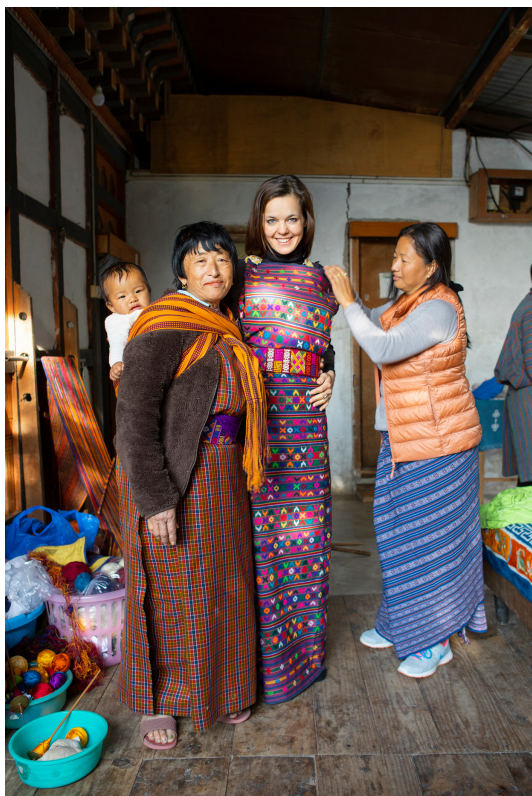
Ženy oblékají kiru jak doma, tak na oficiální návštěvy

Pokud se vám místní móda zalíbí, neváhejte si pořídit kiru (ženský kroj) nebo gho (mužský kroj). Kromě toho, že s tím uděláte mnoho parády, se vám budou lépe navazovat kontakty s místními. Vždy se najde někdo, kdo vás zastaví, aby vám pochválil váš stylový outfit.